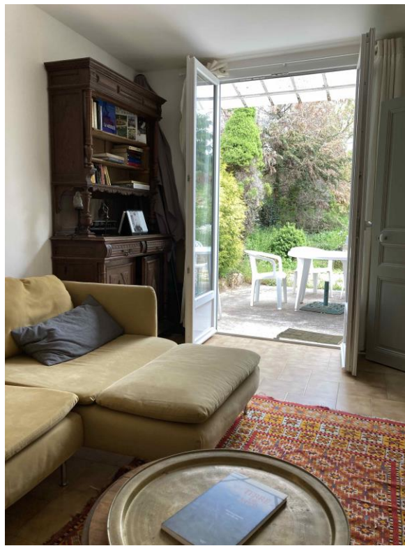
Les parties communes du studio.