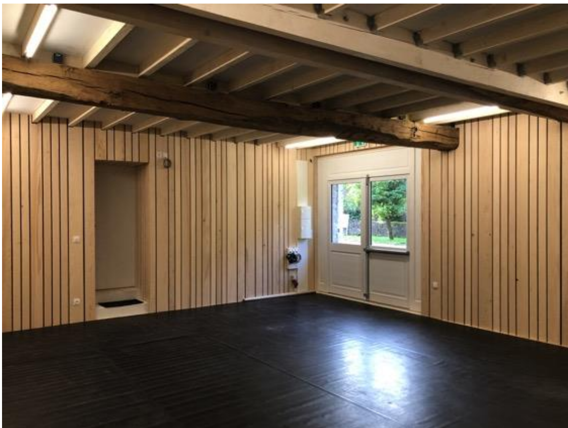
Le Studio Faramine.